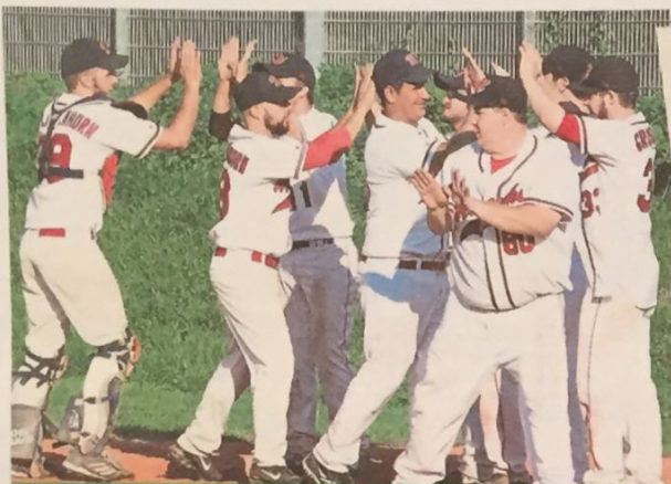
Baseball ist absoluter Team sport. Die »Mohawks« mischen in der Verbandsliga mit.